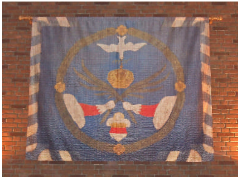
Die rekonstruierte Friedensfahne (Textildruck) in der Bürgerhalle des Rathauses

Die rekonstruierte Friedensfahne von 1648 ist in einer textilen Fassung nun dauerhaft in der Bürgerhalle des historischen Rathauses ausgestellt.